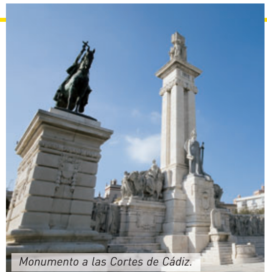
Monumento a las Cortes de Cádiz.